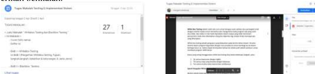
Gambar 4. Pengumpulan tugas pada Classroom

Selain melihat materi dan komentar pada forum mahasiswa diwajibkan untuk mengerjakan tugas yang ada pada tugas kelas. Tugas tersebut dapat sekaligus dikoreksi oleh dosen dan diberikan penilaian.