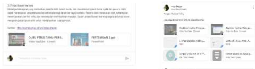
Gambar 4. Materi dan Video Pembelajaran pada Classroom

Setelah kode kelas dibagikan tahapan selanjutnya adalah peserta melihat materi (file & video) pada forum dilanjutkan dengan pengerjaan tugas. Video pembelajaran pada kelas dibuat dengan menggunakan Camtasia Record , dosen memberikan penjelasan materi dalam bentuk video dan dibagikan kepada mahasiswa. Dengan pembelajaran berbasis video mahasiswa dapat melihat penjelasan dosen sehingga lebih mudah dalam menyimak materi tanpa harus bertemu maupun live pada waktu tertentu.