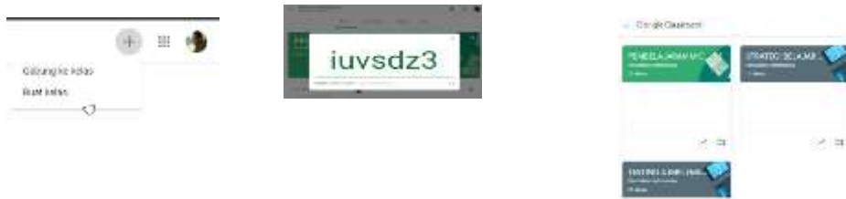
Gambar 3. Membuat kelas dan pembagian code kelas

Langkah selanjutnya adalah membuat kelas dilanjutkan dengan membagikan kode kelas kepada peserta. Pada tahapan ini sekaligus pengguna melakukan uji coba media dan menggunakan sebagai pembelajaran daring .