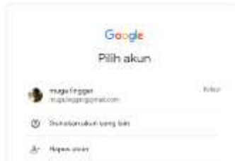
Gambar 2. Login Account Google

Langkah selanjutnya adalah membuat kelas dilanjutkan dengan membagikan kode kelas kepada peserta. Pada tahapan ini sekaligus pengguna melakukan uji coba media dan menggunakan sebagai pembelajaran daring .